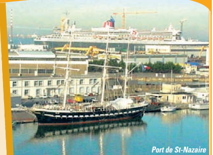
Port de St-Nazaire

Départ de votre ville le matin vers la Loire Atlantique, Saint Nazaire . Visite guidée de la société Airbus Industrie et découverte de l' A380 . Vous pourrez approcher, de très près, la construction du plus gros avion porteur jamais construit au monde . Au cœur des halls de montage et d'équipement, des passerelles de survision font des visiteurs des spectateurs privilégiés ! Saint-Nazaire c'est aussi l'A318, l'A320, l'A330... et bien d'autres encore. OU : visite guidée des Chantiers Navals Aker Yards qui construisent des paquebots aux dimensions spectaculaires : Fantasia et Splendida, 333 m de long sur 38 m de large et 17 ponts. Vous plongerez dans l'intimité de ces navires haute technologie et pourrez appréhender les différentes étapes de la construction. Spectacle garanti ! ☒ au restaurant. L'après-midi, visite accompagnée de personnel de bord, d' Escal'Atlantic, Centre International des Paquebots : musée spectacle qui recrée l'ambiance et les espaces des paquebots mythiques en utilisant les