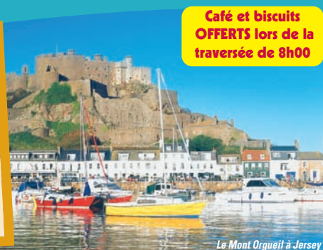
Le Mont Orgueil à Jersey

Salade de crevettes Rôti de porc sauce chasseur Légumes de saison Fromage et crackers Tarte aux pommes et sa crème de Jersey Café