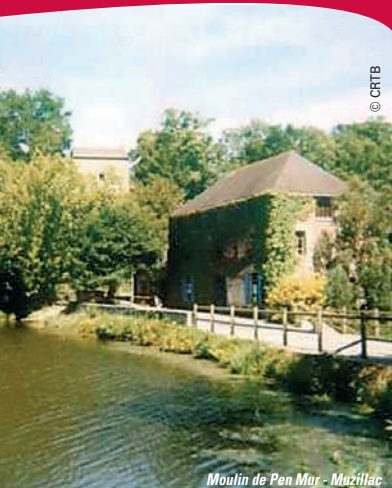
Moulin de Pen Mur - Muzillac

Départ de votre ville en direction du Morbihan . Arrivée à Muzillac , découverte du Moulin de Pen-Mur qui renoue avec la tradition papetière du XV ème siècle, quand on fabriquait le papier à la main à partir de chiffons. Vous assisterez à toutes les opérations de cet ancien procédé depuis le découpage et le tri du chiffon jusqu'au calandrage qui donne au papier son aspect satiné : une belle leçon d'histoire ! Après la visite, départ vers Nivillac et place au festin. Dans un cadre authentique et convivial, vous participerez à une fête unique en Bretagne. Autour d'une bonne table, vous dégusterez les spécialités gauloises : le sanglier sera le héros de la fête ! Après