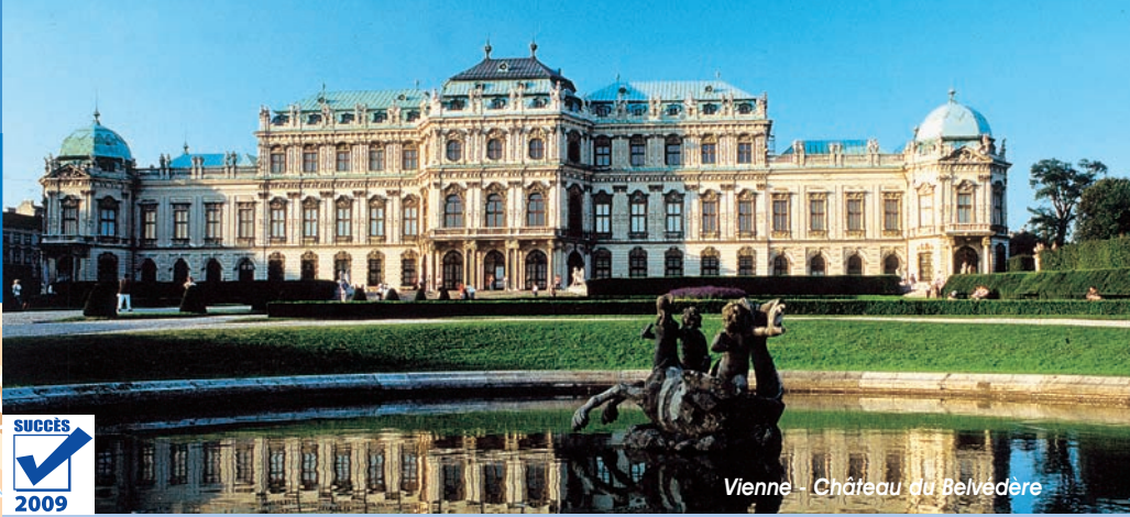
Vienne - Château du Belvedere